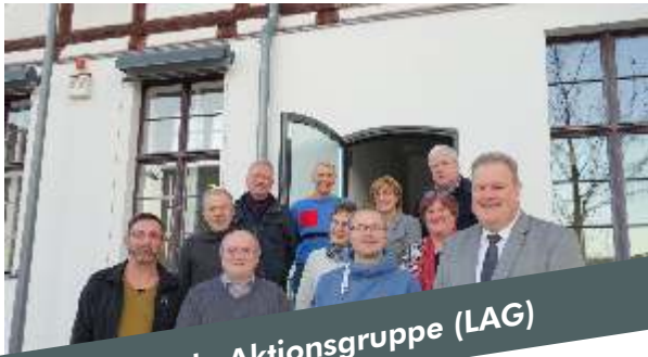
Lokale Aktionsgruppe (LAG)